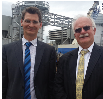
Asesores de la OTA evalúan un proyecto en una central eléctrica en Tanzania.