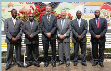
Funcionarios de la OTA y del Banco Central de Kenia en la Escuela de Estudios Monetarios de ese país

La OTA apoya a los miembros de la EAC (Burundi, Kenia, Rwanda, Tanzania y Uganda) en su deseo de desplazarse hacia la integración y la armonización financieras. Tiene proyectos en todos los países miembros en una gama de actividades que comprenden la movilización de ingresos, la supervisión de la banca, el financiamiento de la infraestructura y el desarrollo de los mercados de valores públicos. Con asistencia de la OTA, la EAC ha logrado un progreso importante en la implementación de un sistema de pago integrado que facilitará el comercio transfronterizo en toda la EAC y mejorará las estrategias de gestión de los mercados de valores y de la deuda del sector público.